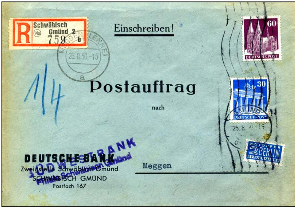
Zwei Postaufträge aus der Bundesrepublik Deutschland: oben vom August 1950 mit einer Bautenfrankatur auf einem vorgedruckten Couvert „Einschreiben!“ • Postauftrag • nach “ von der Südwestbank in Schwäbisch-Gmünd abgesandt wurde, unten die klassische 90 Pf. Posthorn-Einzelfrankatur vom August 1953 von einer Großhandessfirma in Frankfurt nach Marienheide im Bergischen Land. In beiden Fällen ist die 90 Pf.- Frankatur portorichtig.