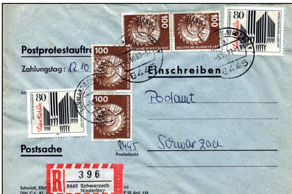
Wesentlich seltener sind erhaltene Umschläge von Postprotestaufträgen. Hier stellvertretend ein Postprotestauftrag aus dem Jahr 1987. Die Gebühren hatten sich im Vergleich zur unmittelbaren Nachkriegszeit drastisch verändert: Der hier portogerechte Beleg setzt sich tarifmäßig so zusammen: Briefgebühr: 0,80 DM plus Einschreiben 2,00 DM plus Vorzeigegebühr 2,80 DM, macht zusammen exakt die verklebten 5,60 DM.