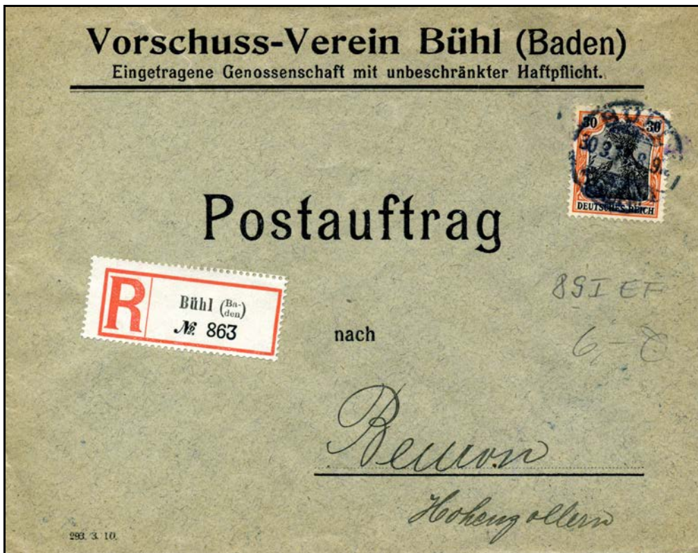
Ein Postauftrag vom 30. März 1911 von Bühl in Baden nach Beuren ins in dreieinhalb-Jahrzehnte spätere Württemberg-Hohenzollern. Absender ist ein sogenannter Vorschuss-Verein in Bühl, die damalige Bezeichnung für eine Kreditanstalt. Die Frankatur mit einer 30-Pf. Germania-Marke war damals portorichtig.